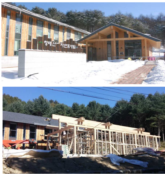
【「自然とともに」建設中のビジターセンターの風景】